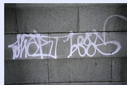
De 'Goudse stadsregels':