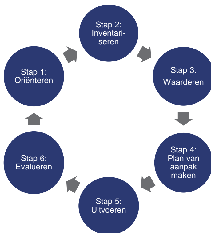
Figuur 3: Stappen loopbaanoriëntatie planner

De Loopbaanoriëntatieplanner bestaat uit zes stappen, gebaseerd op de leercirkel voor professionele teams 8 . In dit geval wordt de leercirkel ingezet om te komen tot een nieuw plan voor loopbaanoriëntatie. Uit voorgaande mag duidelijk zijn geworden dat loopbaanoriëntatie een gezamenlijke verantwoordelijkheid is van het gehele team. Het verdient dan ook aanbeveling een loopbaanoriëntatie team samen te stellen waarin alle leerjaren en vakgroepen vertegenwoordigd zijn. Met behulp van de Loopbaanoriëntatieplanner kan dit team zelfstandig op de school aan de slag met het maken van een nieuw plan voor loopbaanoriëntatie. In de volgende paragraaf worden alle stappen afzonderlijk beschreven.